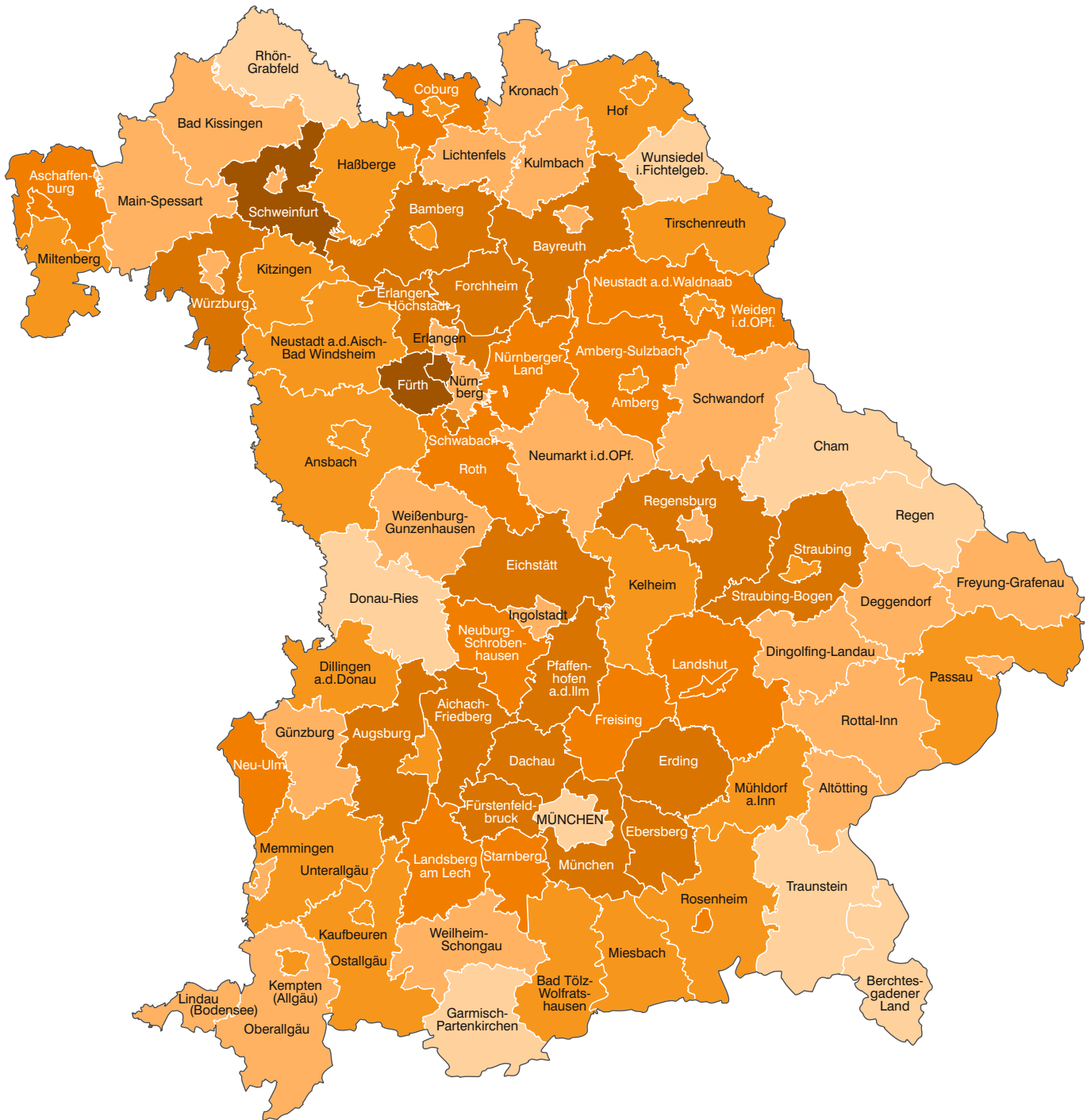
Abb. 1 Anteil der Auspendler an den sozialversicherungspflichtig Beschäftigten am Wohnort in den kreisfreien Städten und Landkreisen Bayerns am 30. Juni 2020 in Prozent