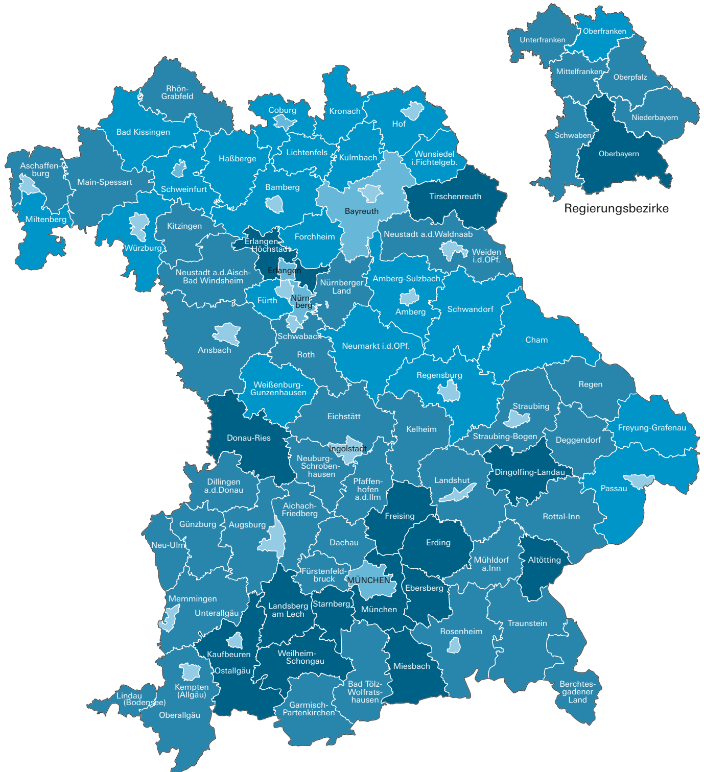
Abb. 3 Kreis- und Bezirksumlage 2022 in den kreisfreien Städten und Landkreisen Bayerns